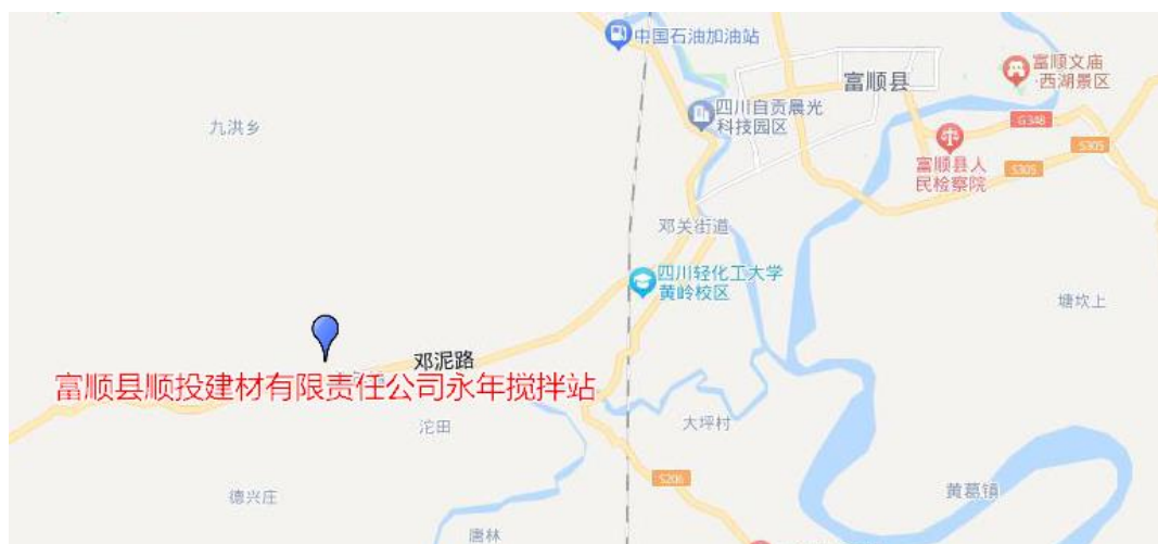
图 1-1 项目地理位置示意图

“富顺县顺投建材有限责任公司永年搅拌站”位于自贡市富顺县永年镇永民村 1 组，项目中心地理位置坐标： 29^{\circ} 08' 12.2'' 北， 104^{\circ} 52' 1.43'' 东，项目地理位置见下图所示：