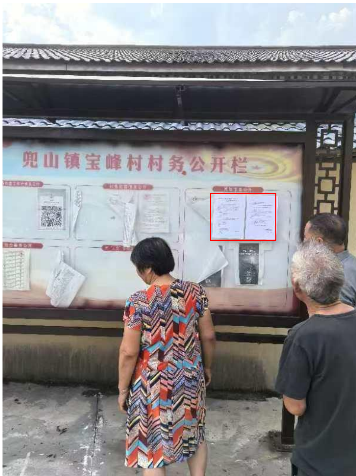
镇宝峰村村委会公示栏处现场张贴公示