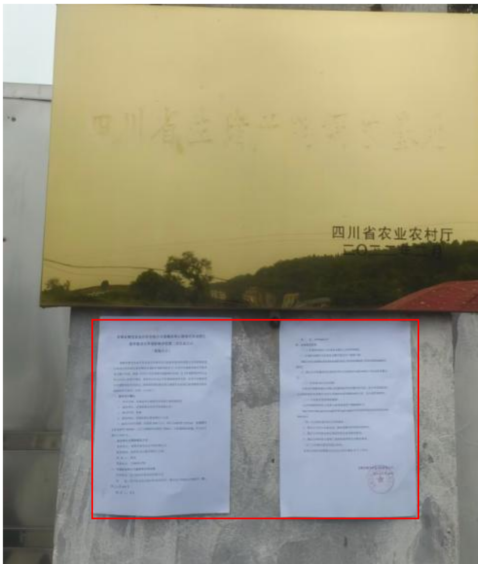
企业现场张贴公示

建设单位于 2024 年 8 月 16 日~2024 年 8 月 30 日在企业宣传栏和兜山镇以及宝峰村公示栏处进行了现场张贴公示，照片如下：